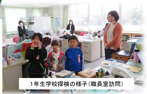
1年生学校探検の様子(職員室訪問)

4月に新学期が始まったとはいえ新型コロナウイルスによる臨時休校で、子どもたちは4月6日(月)から10日(金)の5日間しか学校へ来れません。学校へ来ていた子どもたちの様子や臨時休業中の学校の様子をご紹介します。