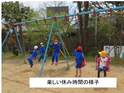
楽しい休み時間の様子