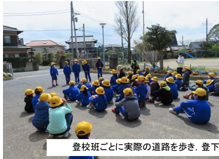
登校班ごとに実際の道路を歩き、登下校で気を付けることについて話し合いました。