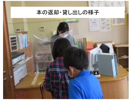
本の返却・貸し出しの様子