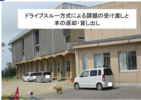
ドライブスルー方式による課題の受け渡しと本の返却・貸し出し