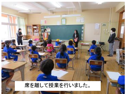
席を離して授業を行いました。