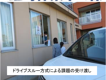
ドライブスルー方式による課題の受け渡し

4月13日(月)より、学校は臨時休業に入っています。保護者の皆様には、課題をとりに来ていただいたり、家庭学習のサポートをしていただいたり、大変お世話になりました。