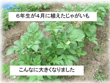
こんなに大きくなりました

4月に新学期が始まったとはいえ新型コロナウイルスによる臨時休校で、子どもたちは4月6日(月)から10日(金)の5日間しか学校へ来れません。学校へ来ていた子どもたちの様子や臨時休業中の学校の様子をご紹介します。