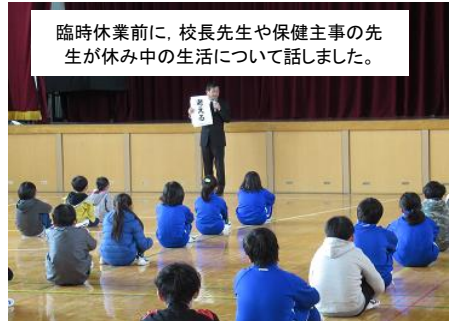
臨時休業前に、校長先生や保健主事の先生が休み中の生活について話しました。