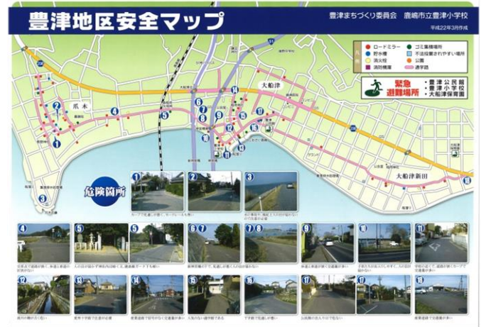
豊津地区の安全マップ 14