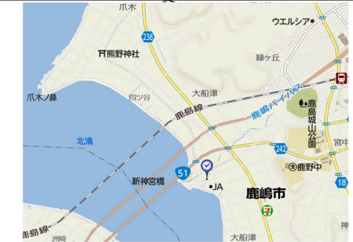
豊津地区の避難場所マップ 10