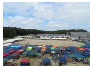
(昨年度の参観の様子)

21日にPTA会長様より「今年度の運動会への参観について」の文 書が出されました。今年度は、新型コロナウイルス感染予防のため、 参観者を1家族2名までとさせていただきますことになりました。児童の 活動を御家族、地域の皆様に観ていただけないことは本当に残念でな りません。しかし、児童さらには参観いただく方々の感染予防のため の対応であると御理解いただき、ルールを守った参加・参観をお願 いいたします。今年度の運動会が実施できますよう、今後も御家庭での 感染予防等への御協力をお願いいたします。