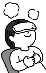
目が疲れたときは蒸しタオルなどで温める

オンライン授業が始まり、目の疲れ、目・頭・耳の痛みが出る人が多くいました。タブレットやテレビ・パソコンの画面を見つづけないように、工夫しましょう！目を守るために、裏面にある資料や下の目の体操のイラストを参考にしてくださいね！