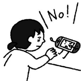
ゲームやスマホの見過ぎに注意