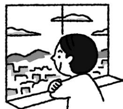
たまには遠くの景色を眺めてリラックス