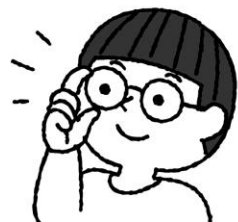
メガネ、コンタクトは自分の度にあったものに